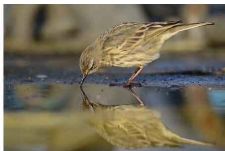
Concours photos nature de mars 2019